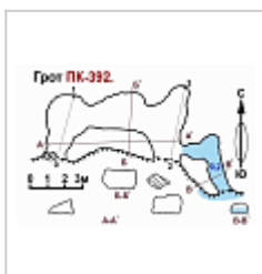
ПК 392 план и разрез