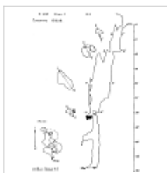
160 лет Ялты План и разрез. Автор А.В. Папий