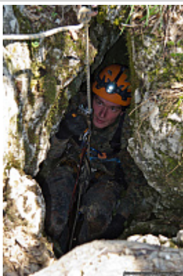
Вход в пещеру