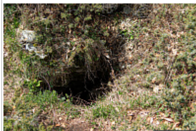
Вход в пещеру