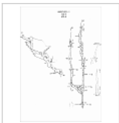
459-8 АК 4 План, разрез