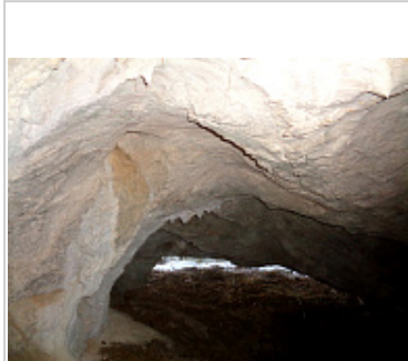
Вид из привходового грюта на выхюд