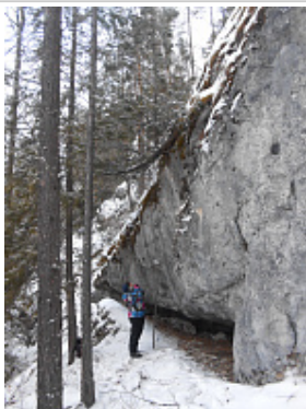
Вид на вход в пещеру