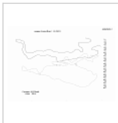
Алупка-Исар 1 Разрез. Автор А.В. Папий. 2001 г.