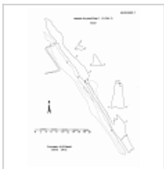
Алупка-Исар 1 План. Автор А.В. Папий. 2001 г.