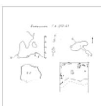
Антропоген План и разрез. Автор А.В. Папий