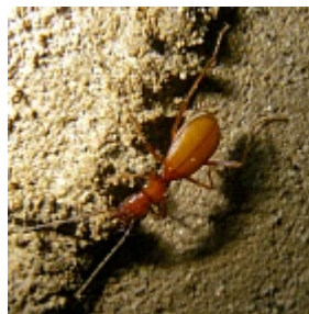
Pseudaphaenops jacobsoni (Pliginskiy, 1912)