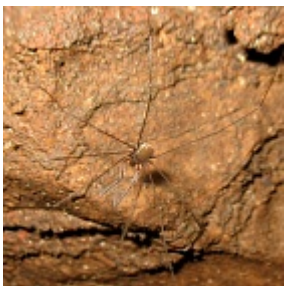
Nemaspela caeca (Grese, 1911)