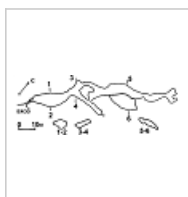
437-2_Белоснежка 1 План