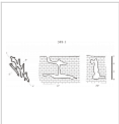
Богурча План, разрез