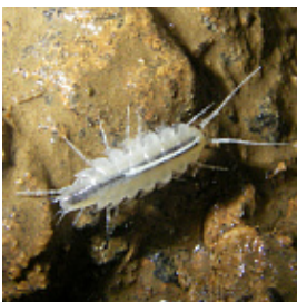
Taurolidium stygium Borutzky, 1950