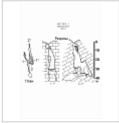
407-2 Вернадского План, разрез