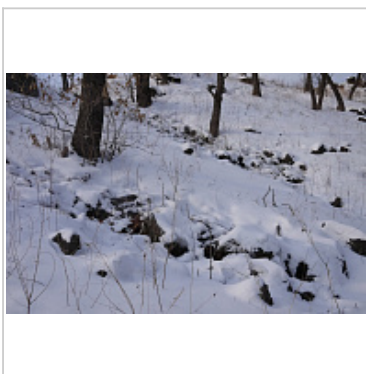
склон над пещерой с многочисленными проталинами

на фоне неба виден пар , выходящий из пещеры