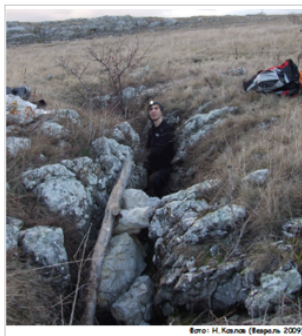
Фото: Н. Колес (Весна 2009)