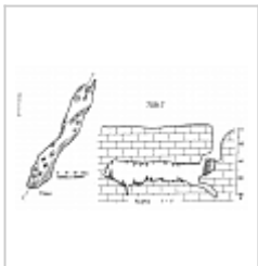
План и разрез Съемка ККЭ