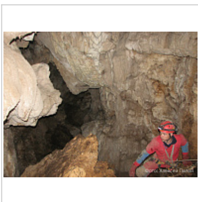
Заловая (Таёжная, 197-33)

Костные останки в Таёжной