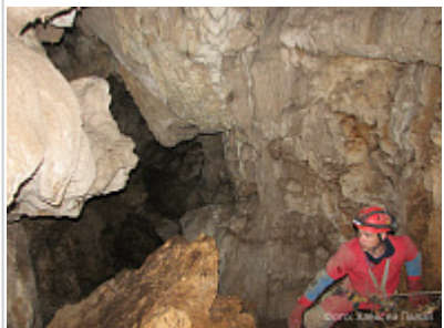
Заловая (Таёжная, 197-33)

Костные останки в Таёжной