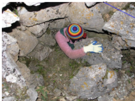
Вход в пещеру. Фото: А.Гипен, Август 2008