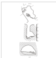
Капку-Кую план и разрез