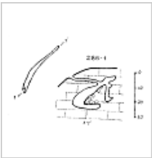
Каплы-Каянская План и разрез