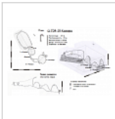
План и разрез Съемка Верченко А.