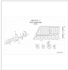
579-3 Конгломератовая План, разрез