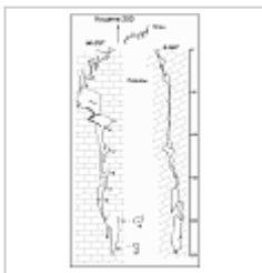
443-24 Кошина 200_гопо План, разрез