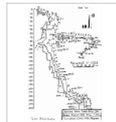
Кошина 200 СТО СТО