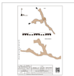
План и разрез АКС 2021