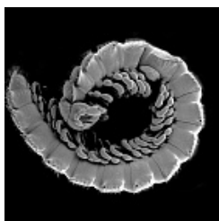
Caucasodesmus svetlanae Golovatch et VandenSpiegel, 2015