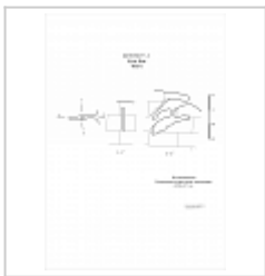
400-6 Куш-Кая План, разрез