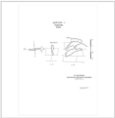
400-6 Куш-Кая План, разрез