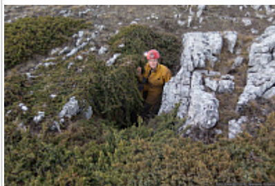
Вход в пещеру Ловушка