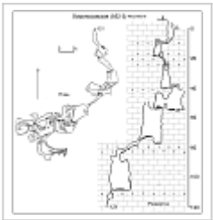
План и разрез Съемка Тк Карадаг, Жуков А.А.