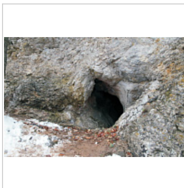
Пещера Люка 2 Вход Автор: А.В. Папий