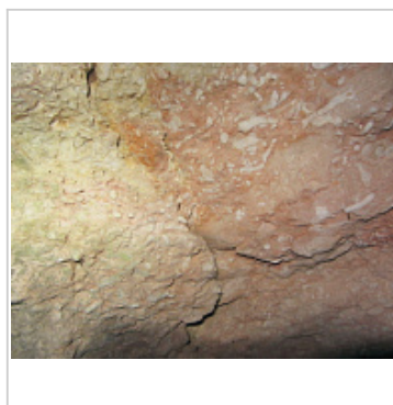
Пещера Люка 2 Структура известняка в п. Люка 2 Автор: А.В. Папий