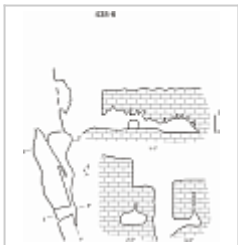
МЦ-13 план и разрез