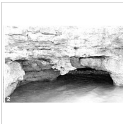
ПК-457. Общий вид