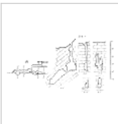
Медвежья План и разрез