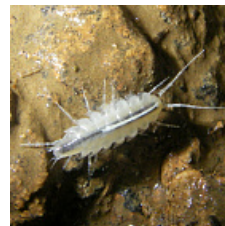
Taurologidium stygium Borutzky, 1950