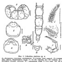
Lithobius skelicus Zalesskaja, 1963