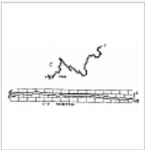
Нассонова План и разрез-развертка В.Н.Дублянский