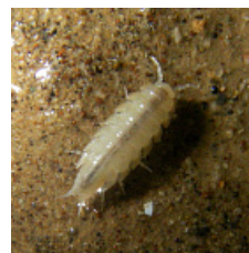
Tauronethes lebedinskyi Borutzky, 1949