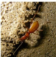
Pseudaphaenops jacobsoni (Pliginskiy, 1912)