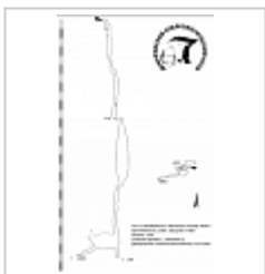
План и разрез Съемка Шеремет С., Шевченко Е.