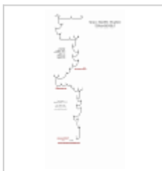
Часть схемы навески Май 2017 года, пещера была запасной, дойти до дна не хватило времени