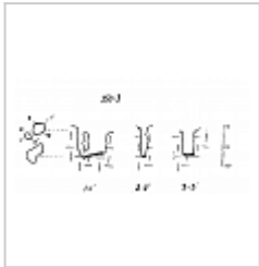
Нивальная-I План и разрезы.