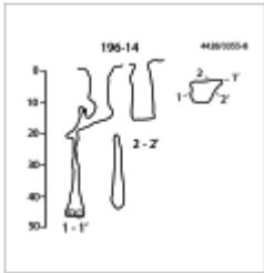
Новогодня План и разрезы