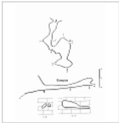
Нора План, разрез