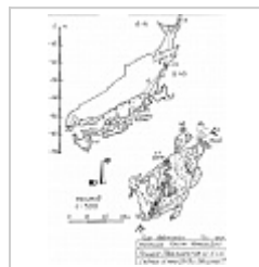
План-разрез 2009 План-разрез 2009