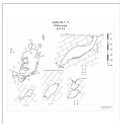
453-14 Обвальная План, разрез