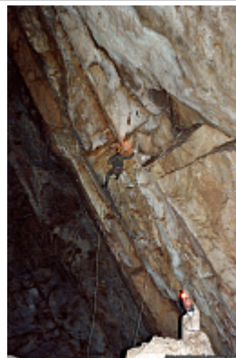
Зал в пещере Обвальная