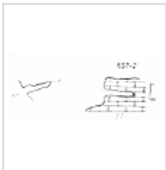
План и разрез Съемка ККЭ