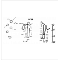
Очки Разрезы, сечения