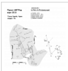
План Съемка Верченко А.