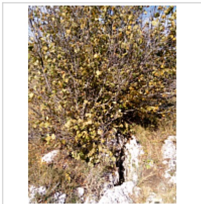
ВХОД ПОД КУСТОМ