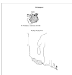
Провальная План и разрез