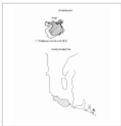
Провальная План и разрез