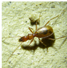
Pseudaphaenops tauricus (Winkler, 1912)