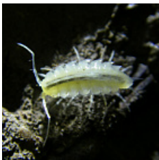
Typhlogolidium karabijajlae Borutzky, 1962