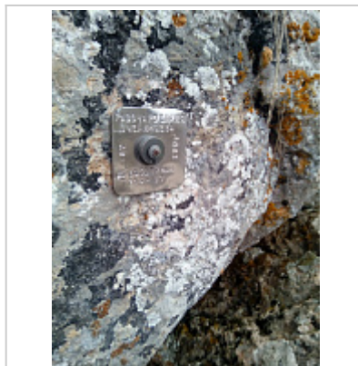
Марка на входе