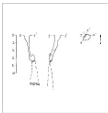
Рождественская План и разрез. Автор А.В. Папий