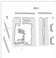
Русская-Залесская план и разрез