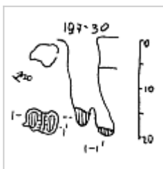
СПС-67 План и разрез