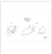
Сакральная План, разрез

Вход находится на склоне на небольшом гребне. Вход прикрыт деревом. Спуск в пещеру по стволам дерева. Внизу просторный зал. Дно земля и камни. Есть немного старой натечной корки.