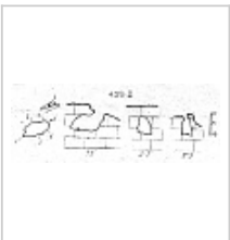
439-2 Оригинальная топо ККЭ. План, разрез.