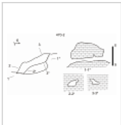
Сары-Кая-2 план и разрез